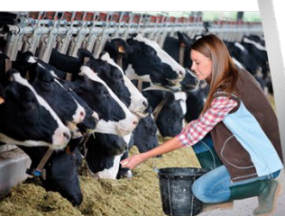
Bac Pro CGEA Polyculture - Elevage Formation en 3 ans Supports de stage: Elevage Bovin/Equin Elevage Toutes Espèces Production végétale