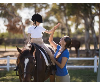
BPJEPS Educateur Sportif Formation en 1 an par apprentissage ou en formation continue Mention «Activités équestres» Mention «Activités Pour Tous»