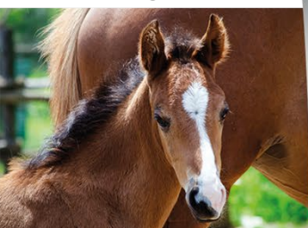
Bac Pro CGEH Formation en 3 ans