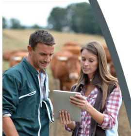
B TSA PA Formation en 2 ans par apprentissage

Certains travaux sont interdits aux jeunes de moins de 18 ans. Cependant il est possible de déroger à cette interdiction pour les jeunes âgés d'au moins 15 ans, quand ces travaux sont nécessaires à leur formation professionnelle (ce qui exclut les jeunes inscrits en classe de 4 ème et de 3 ème , même