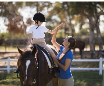
BPJEPS Educateur Sportif Formation en 1 an par apprentissage ou en formation continue Mention «Activités équestres» Mention «Activités Pour Tous»