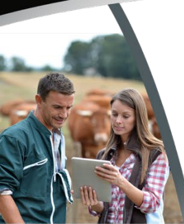
BTSA PA Formation en 2 ans par apprentissage

L'entreprise ou l'organisme d'accueil doit inscrire le stagiaire