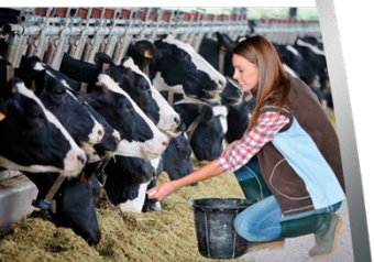
Bac Pro CGEA Polyculture - Elevage Formation en 3 ans Supports de stage: Elevage Bovin/Equin Elevage Toutes Espèces Production végétale