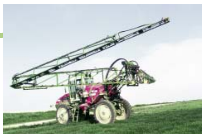
Circulation d'engins de grande taille