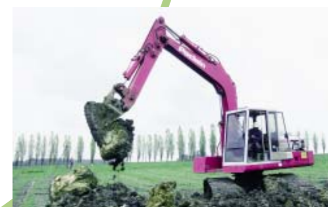
Travaux de drainage