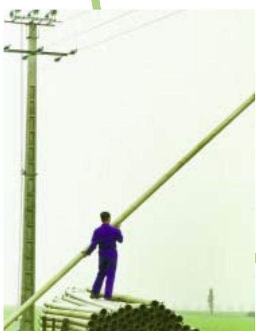
Manipulation de tuyaux d'irrigation